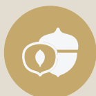
FRUTTA A GUSCIO