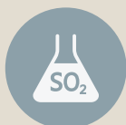
ANIDRIDE SOLFOROSA E SOLFITI